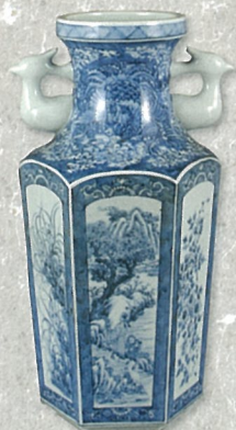
姫路の焼物「東山焼」