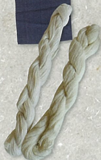
姫路藩の名産 木綿