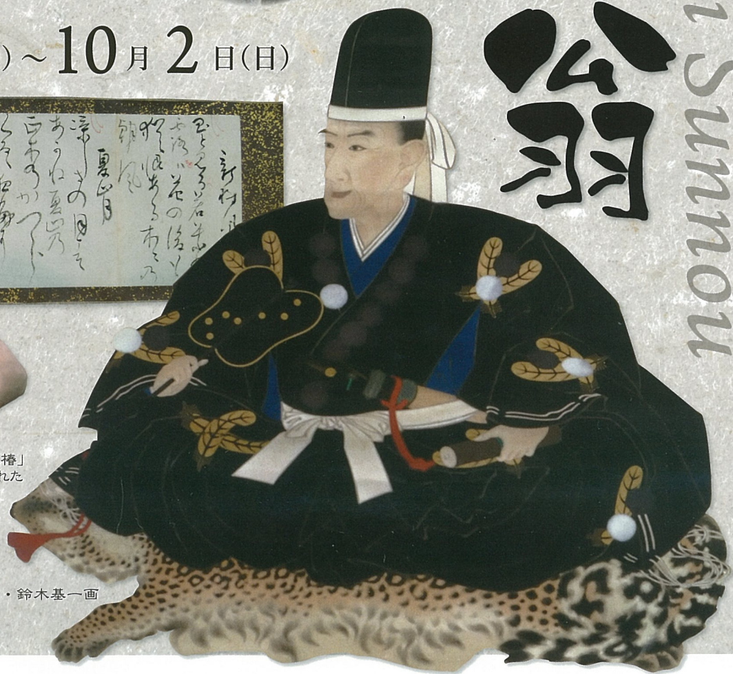
寸翁像・鈴木基一画