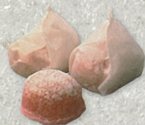
伊勢屋本店「玉椿」 寸翁により命名された 姫路の名菓