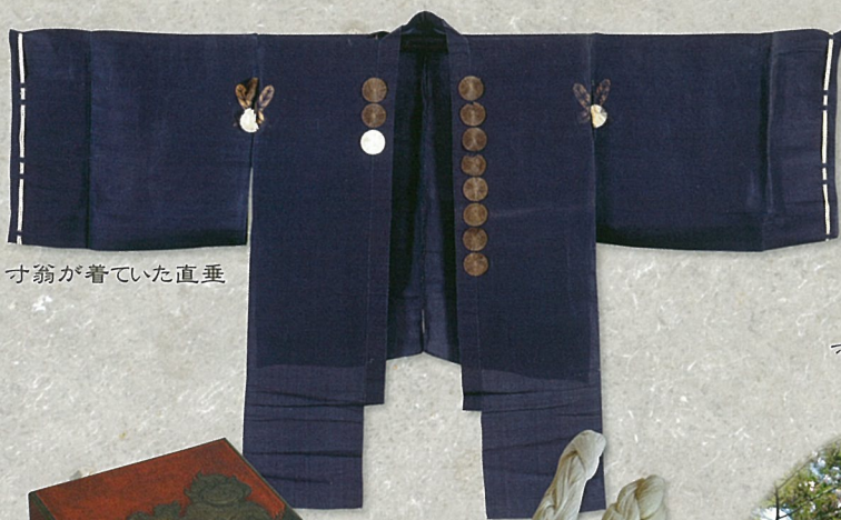
寸翁が着ていた直垂